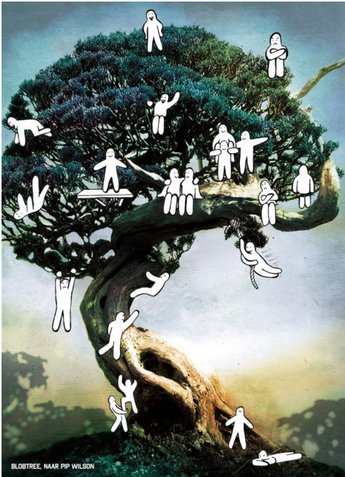
Afbeelding 2 The Blobtree, naar Pip Wilson