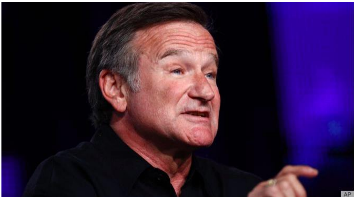
Afbeelding 3 Ruzie om erfenis Robin Williams escaleert.